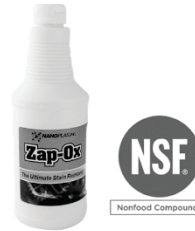
圧倒的な錆落とし効果ZAP-OXクリーナー