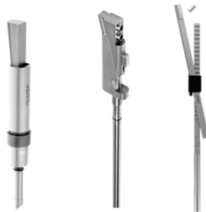
金型加工、組込み工数を大幅に削減する CUMSAアンダーカット処理部品